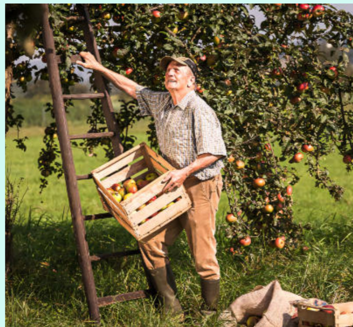
Von der Apfelernte bis zum fertigen Getränk legt die Kelterei Dölp Wert auf Qualität, Frische und regionale Früchte.