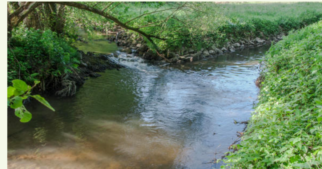
Der Zusammenfluss des Osterbachs (links) mit dem Mergbach (rechts) bildet die Gersprenz (vorn).