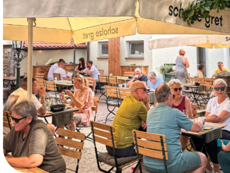
Biergarten Scholze Gret in Brensbach