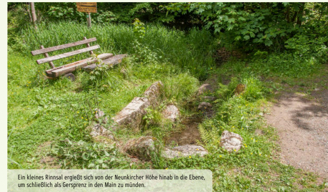
Ein kleines Rinnsal ergießt sich von der Neunkircher Höhe hinab in die Ebene, um schließlich als Gersprenz in den Main zu münden.

Kehren wir wieder zurück zu den Kelten und den irischen Mönchen und nehmen das altirische Wort „car“, oder auch „cas“ geschrieben, hinzu, das Bach bedeutet und berücksichtigen die sprachliche jahrhundertlange Umwandlung zu „ger“, so haben wir die erste Silbe unserer Gersprenz bzw. der Ortschaften. Somit können wir die Namensgebung auf keltischen Ursprung zurückführen. Bezüglich des Wasserlaufs muss es