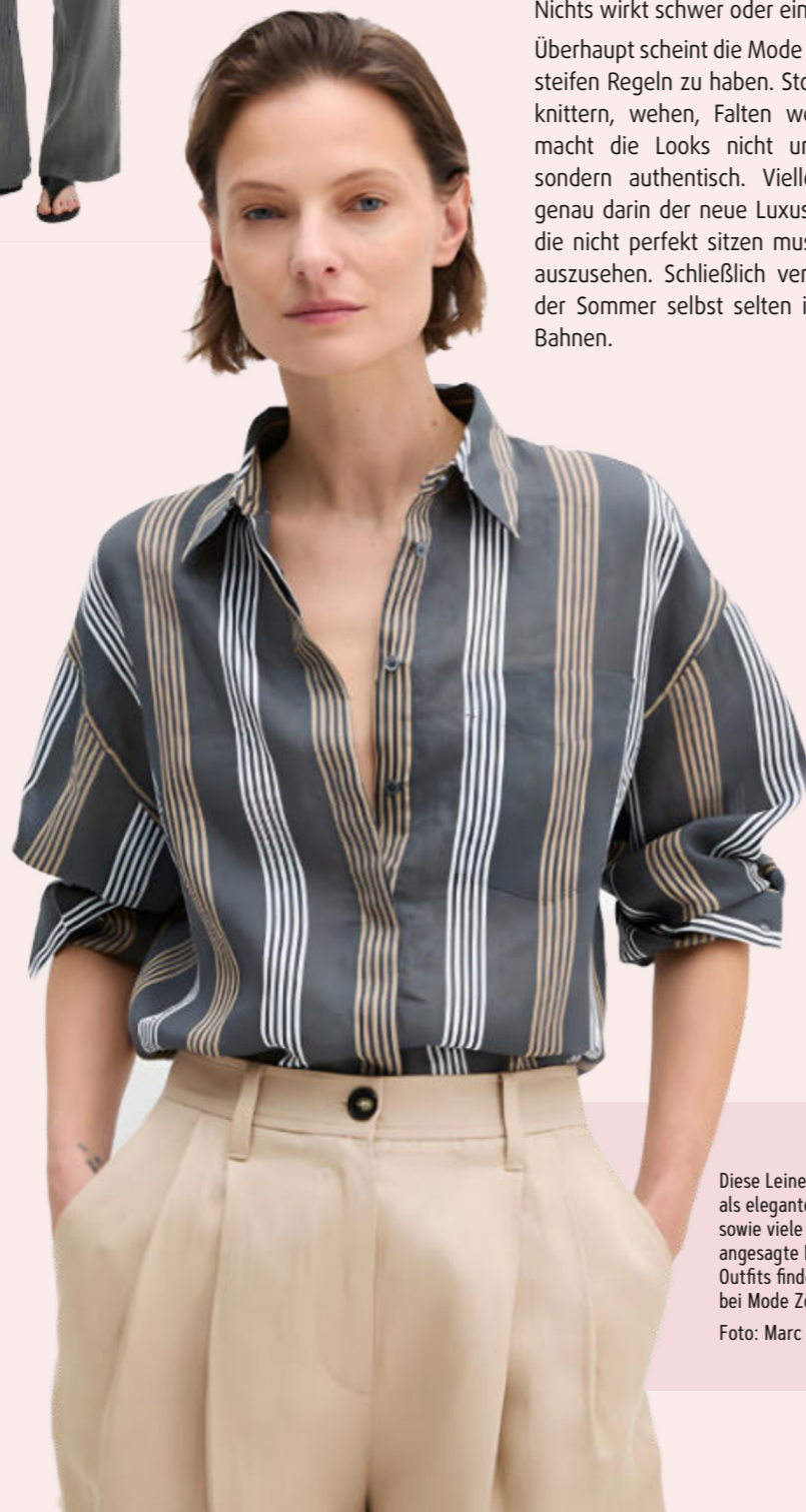
Diese Leinenbluse als elegante Version sowie viele weitere angesagte Leinen-Outfits finden sich bei Mode Zörgiebel.

Überhaupt scheint die Mode genug von steifen Regeln zu haben. Stoffe dürfen knittern, wehen, Falten werfen. Das macht die Looks nicht unordentlich, sondern authentisch. Vielleicht liegt genau darin die neue Luxus: Kleidung, die nicht perfekt sitzen muss, um gut auszusehen. Schließlich verläuft auch der Sommer selbst selten in geraden Bahnen.