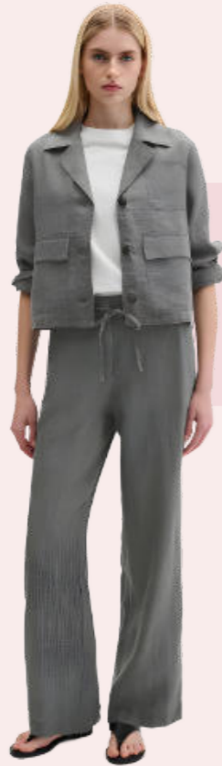
Der neu und lässig interpretierte Leinenanzug liegt in diesem Sommer im Trend.

Leinen ist gerade überall zu sehen: in oversized Hemden, weiten Hosen oder lockeren Zweiteilern sowie Kleidern in Naturtönen. Das Besondere liegt in seiner Struktur. Der Stoff wirkt nie komplett glatt, sondern immer ein bisschen bewegt – fast so, als hätte er gerade selbst Urlaub gemacht. Genau das macht ihn so spannend. Leinen wirkt nie überstylt, sondern vermittelt eine entspannte Eleganz – als hätte sich der Look ganz selbstverständlich ergeben und genau deshalb Stil. Die Naturfaser nimmt Feuchtigkeit schnell auf, lässt Luft zirkulieren und klebt selbst bei Hitze nicht unangenehm auf der Haut. Somit ist Leinen ideal für die jetzt steigenden Temperaturen.