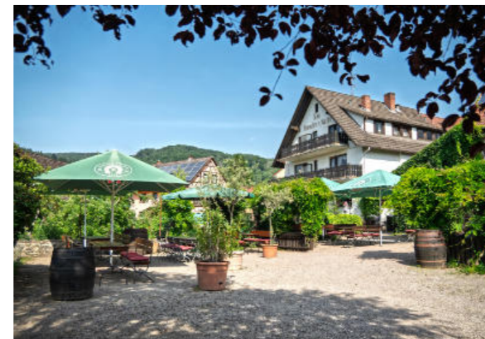
Biergarten Römischer Kaiser in Schlierbach