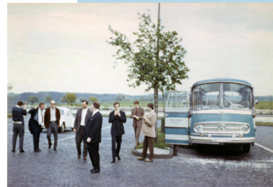
Reisegruppe auf einem Esso-Rasthof im Winter, Ende 50er Jahre