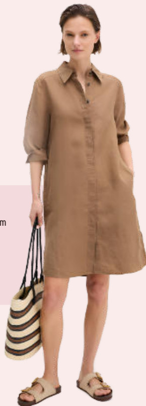
Unkomplizierteres Leinenkleid in einem wunderschönen Naturton von Marc O'Polo.