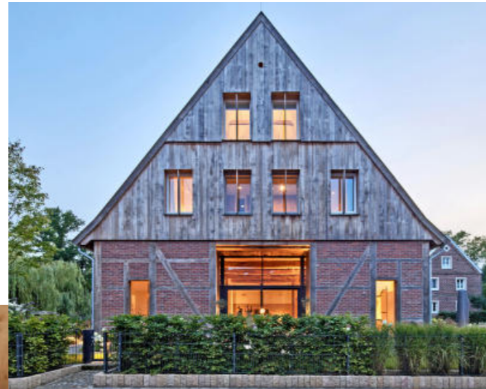
Bei der Sanierung historischer Fassaden, wie hier an einem Bauernhof in Münster, ist viel Fachwissen gefragt.

Nachhaltigkeit endet jedoch keineswegs außen. Bei der Innengestaltung achten viele Hauseigentümer heute bewusst auf möglichst emissionsarme Produkte. Konservierungsmittelfreie Innenfarben wie das Vita-Sortiment, Produkte mit zertifizierten Umweltlabels oder mit Bindemitteln aus nachhaltigen Rohstoffen werden diesem Anspruch gerecht. Zudem sind mittlerweile etwa alle Innenfarben von z. Bsp. Brillux konservierungsmittelfrei. Mehr Informationen und eine individuelle Beratung gibt es im Fachhandwerk, Ansprechpartner vor Ort lassen sich unter www.brillux.de/zuhause finden. Die Fachleute bringen Nachhaltigkeit und Qualität auf einen Nenner, damit Gebäude mit Geschichte auch noch viel Zukunft vor sich haben. (DJD)