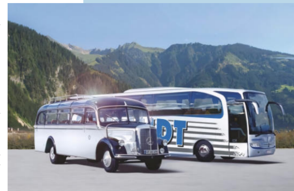
Bild zum 100-Jährigen-Jubiläum, 2011