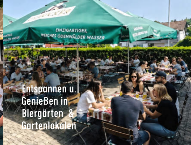
Biergarten La Dolce Vita in Reichelsheim

Entspannen u. Genießen in Biergärten & Gartenlokalen