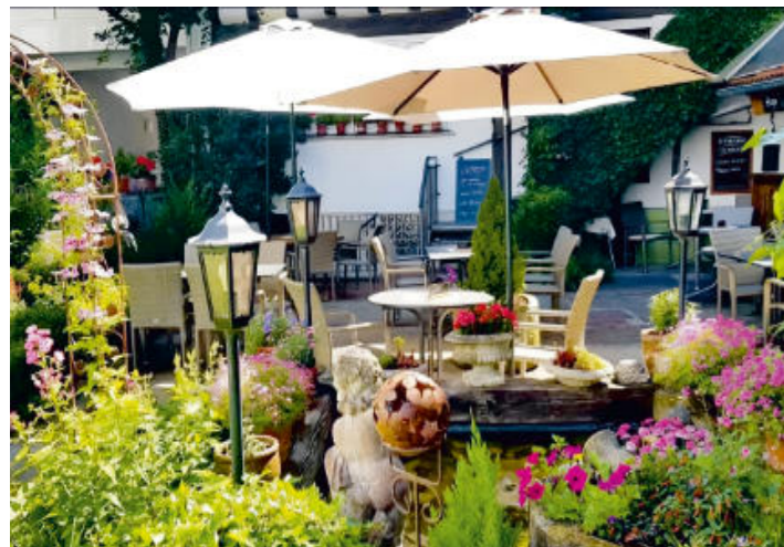
Biergarten Linde in Fr.-Crumbach