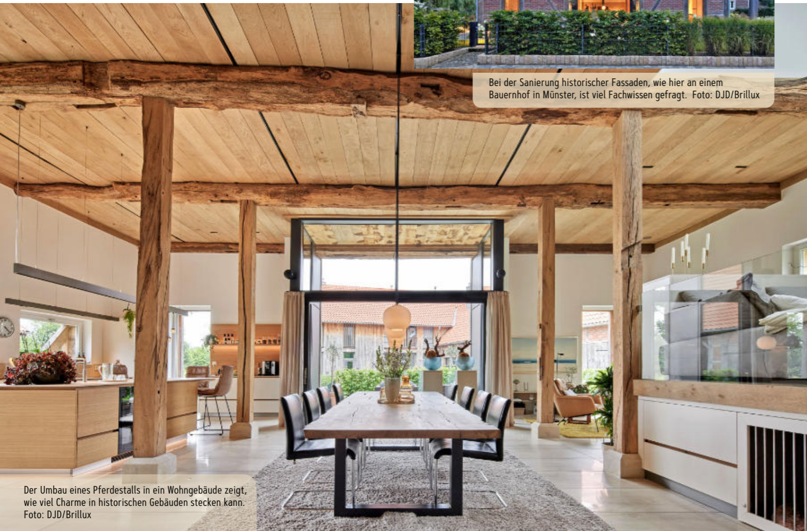
Der Umbau eines Pferdestalls in ein Wohngebäude zeigt, wie viel Charme in historischen Gebäuden stecken kann.