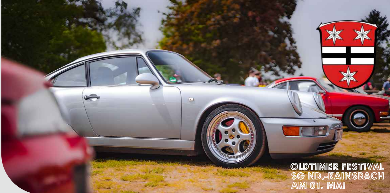
OLDTIMER FESTIVAL SG ND.-KAINSBACH AM 01. MAI

Besonders spannend im Jahr 2026: Die Helden der 90er Jahre erreichen massenhaft den Oldtimer-Status. Autos wie der erste Audi A4, der Merce-