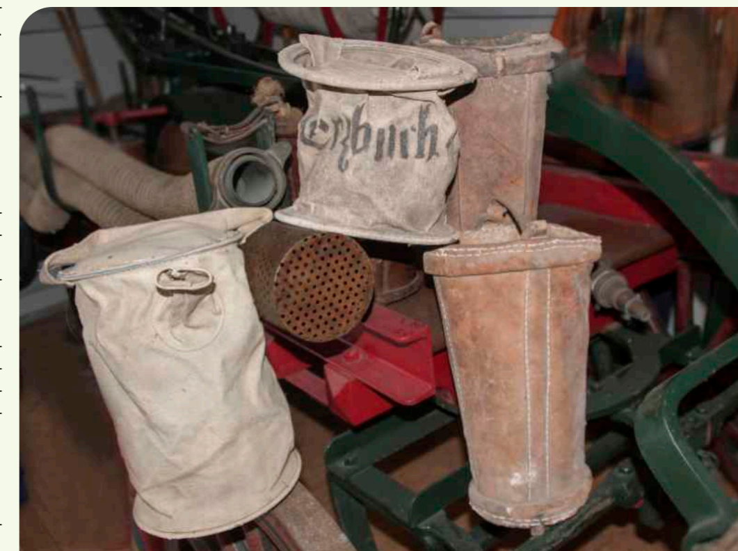
Feuerlöscher aus Leder und Leinen, wie sie die Bewohner der Orte besitzen mussten, gehören zur historischen Sammlung der Freiwilligen Feuerwehr Reichelsheim.

Mit der 1821 in Hessen neu eingeführten Gemeindeordnung, dem Vorläufer der HGO, wurde die Ungleichheit zwischen Gemeinmännern und Beisassen beseitigt, wobei allerdings Übergangsregelungen für eine faktische Fortdauer einzelner Benachteiligungen sorgten.