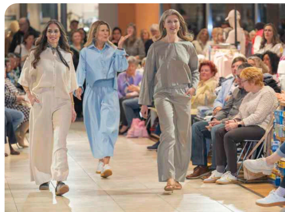
Leichte Stoffe, helle, natürliche Farben und ungewöhnliche Schnitte zeichnen die aktuelle Frühlingmode aus. Hier beispielsweise Kombinationen des Modelabels Drykorn.

...mode und mehr Kolumne von Nadine Zörgiebel