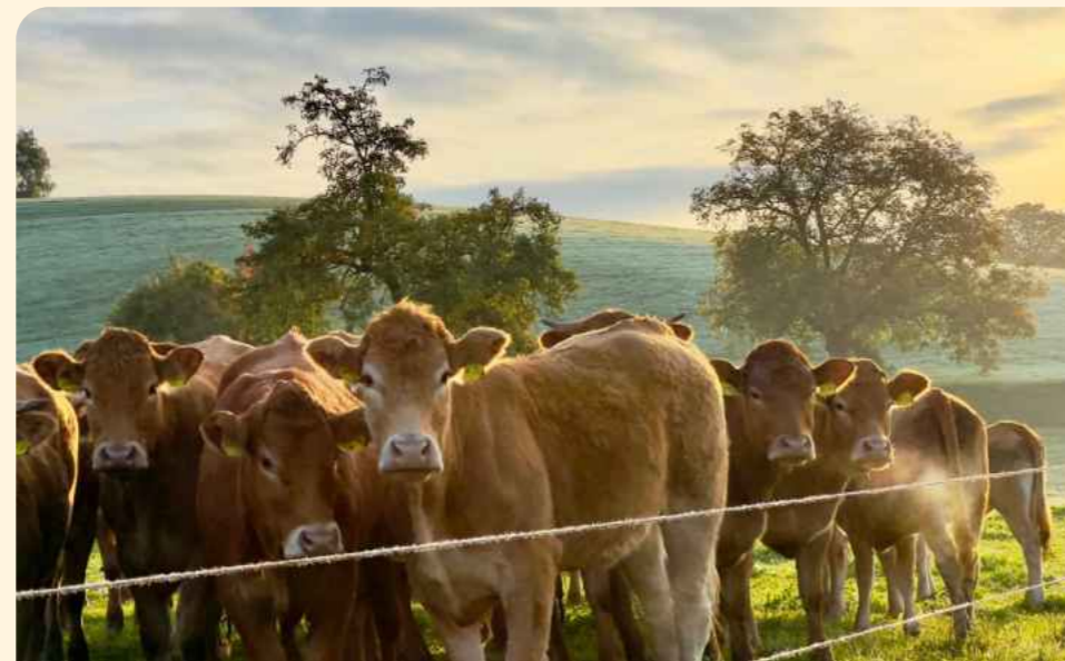
Der Hof Schleiersbach ist für seine Limousin-Rinderzucht und Direktvermarktung bekannt.

Fest im Jahresprogramm verankert sind die kulinarischen Spaziergänge, die Wissensvermittlung mit dem Geschmack des Odenwalds vereinen. Unter dem Motto „So schmeckt der Frühling“ startet am 26. April um 11:00 Uhr der erste Sonntagsspaziergang mit anschließendem reichhaltigem Mittagessen. Der Hof Schleiersbach lädt gemeinsam mit den Rangern des Geoparks dazu